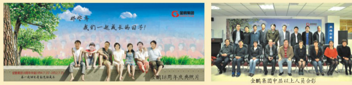
金鹏集团18周年联欢会现场 金鹏集团分公司北京金元汇博泰公司 金鹏集团全体员工共同庆祝金鹏18岁生日 金鹏18周年庆典照片 金鹏集团中层以上人员合影