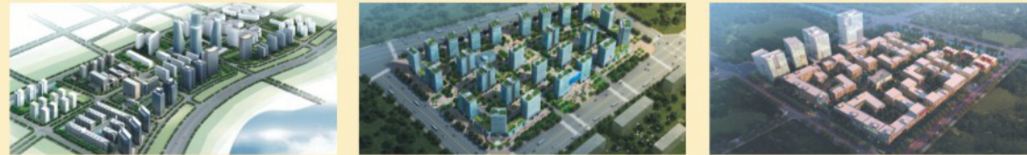
高新区大学生创业园 金水区大学生创业园 南京大学生创业园