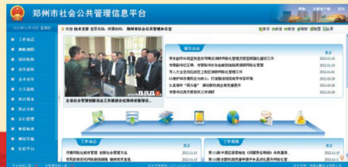
郑州市网格化社会公共管理信息平台主页面