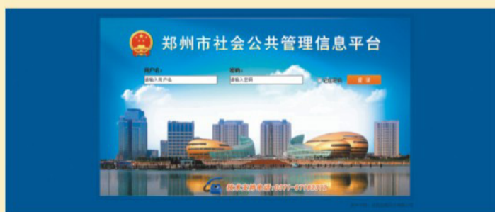
金鹏集团承建的郑州市网格化社会公共管理信息平台

这是全体金鹏人团结奋斗、努力拼搏的结果，感谢在投标过程和项目建设中付出辛勤劳动的同事们。这次软硬件中标又是一个新的起点，金鹏人将会在此起点上，付出更多的努力，提供更好的产品，服务更多的客户，不断创新新辉煌！