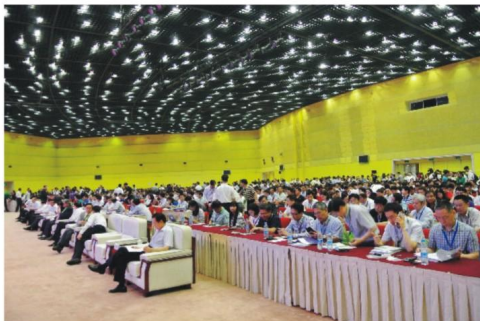
创新创业大会暨全球峰会现场

业出席大会,与来自海内外的数百名业界领袖及行业代表汇聚一堂,共议新常态环境下的创新驱动发展之道。